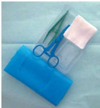
Suture Set (Dressing Set) Code No. 14086

در جای خشک نگهداری شود فقط یکبار مصرف گردد زمانیکه بسته بندی باز و یا خراب شده استفاده نشود استریل بوسیله اتیلن اکساید