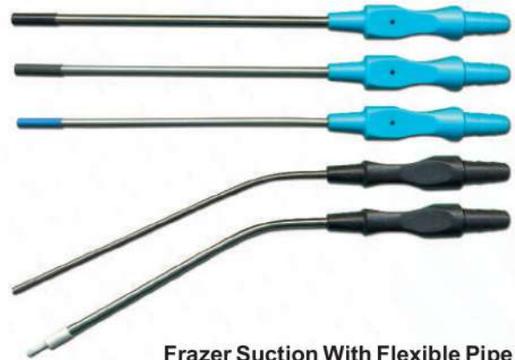
Frazer Suction With Flexible Pipe