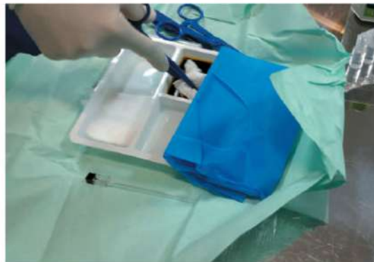
Prep Set Code No. 14087